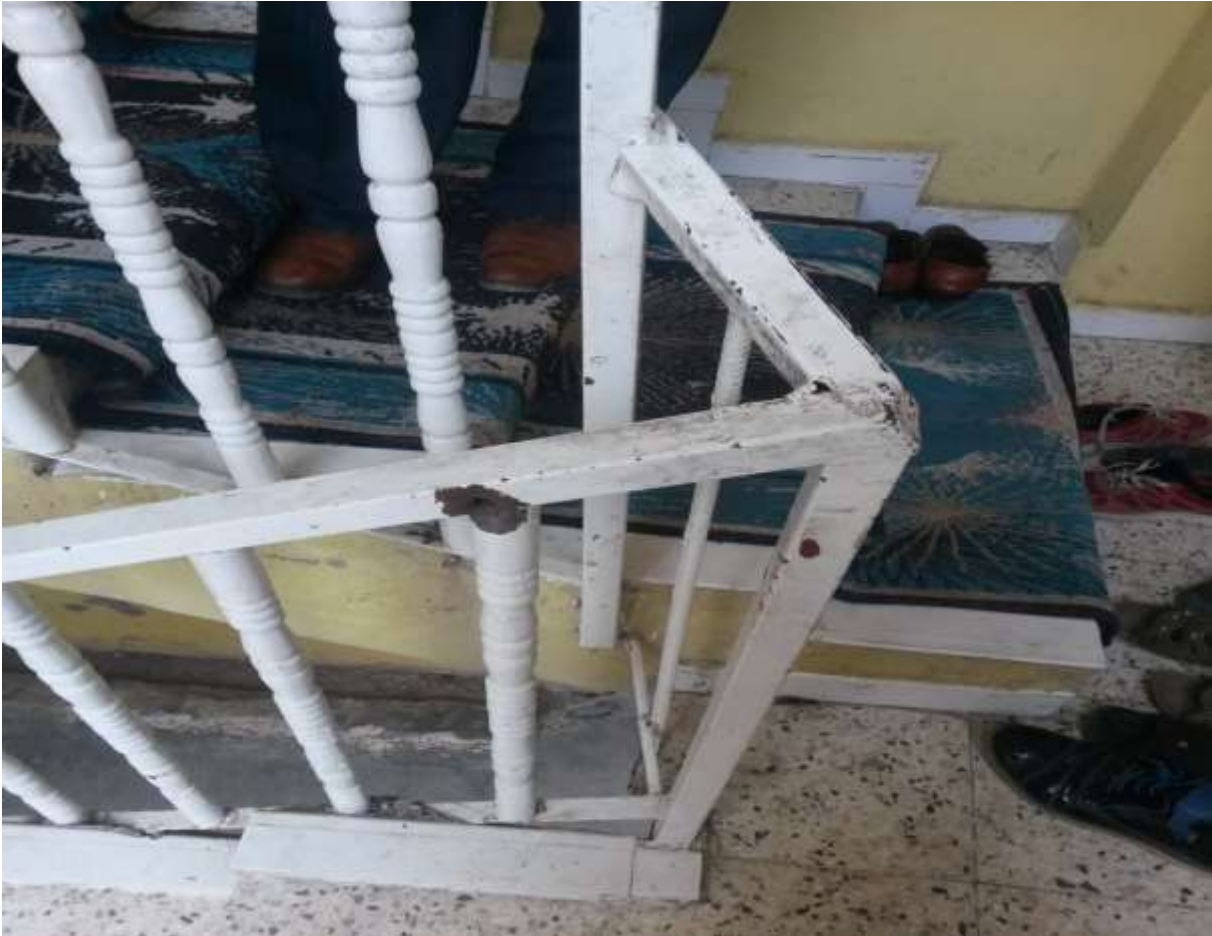
Foto 2. Miray İnce'nin vurulduğu iddia edilen noktada görülebilen bir kurşun izi

(İki katlı evin merdivenleri karşı tepeden rahatlıkla görülebiliyor, önü açık durumda. Miray'ın amcasının işaret ettiği tepe merdivenlere ve bahçeye hakim olup, polislin mevzilendiği iddia edilen bir nokta.)