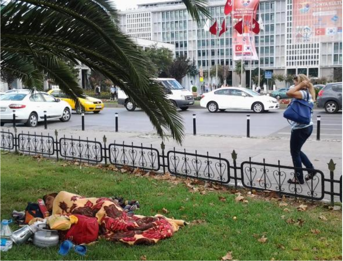
İstanbul Büyükşehir Belediyesi karşısındaki Şehzadebaşı parkında yanında mutfak eşyaları ile yatan Suriyeli mülteci