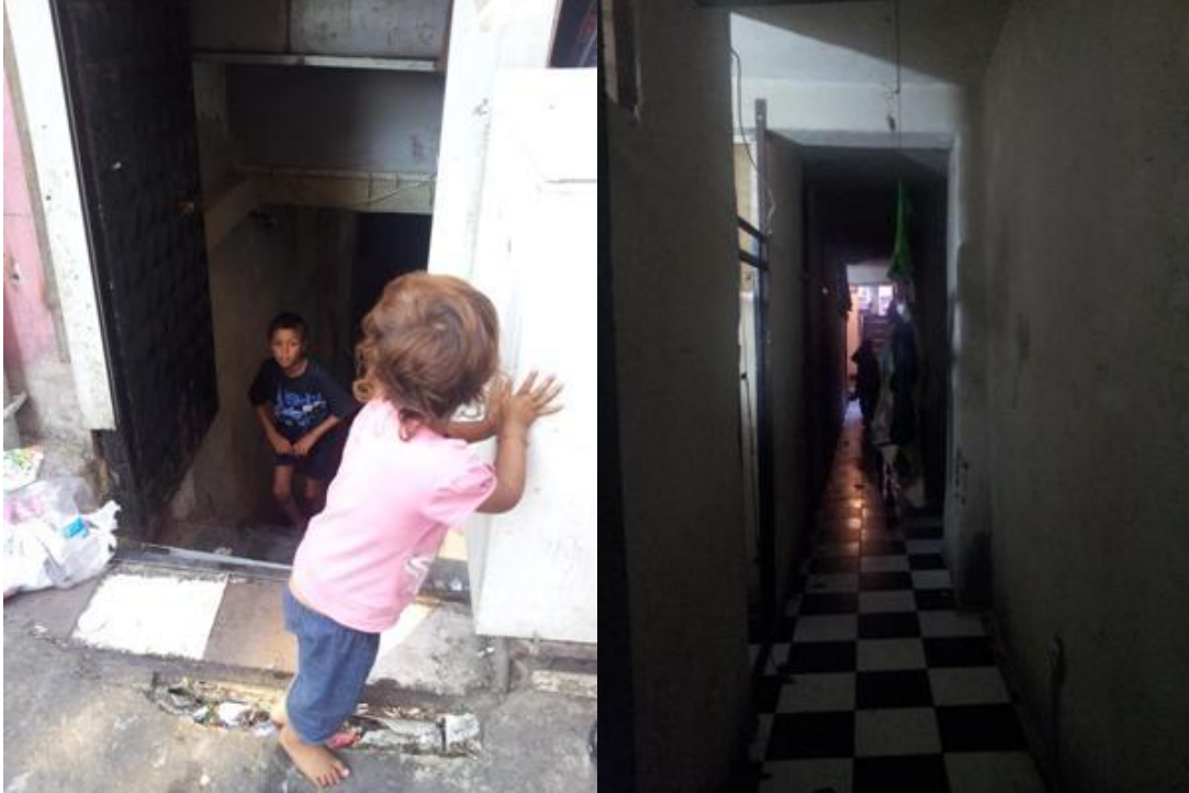
Suriyeli mültecilerin barınakları

Bodrum katında yer alan odaların pencerelerinin bulunmadığı evlerin sağlıksız ve hastalıklara davetiye çıkaran bir özellik taşıdığı gözlenmiştir.