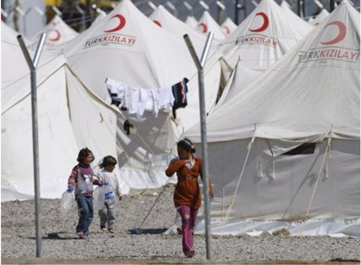
Islahiye Mülteci kampı, Gaziantep

Birleşmiş Milletler Mülteciler Yüksek Komiseri Antonio Guterres, 16 Temmuz 2013 günü Suriyeli sığınmacılar için çağrıda bulunarak, "Bölge ülkelerine ve bölge dışındaki ülkelere sınırları açık tutma ve korunma bekleyen tüm Suriyelileri kabul etme konusundaki çağrısını" yenilemiştir. 20