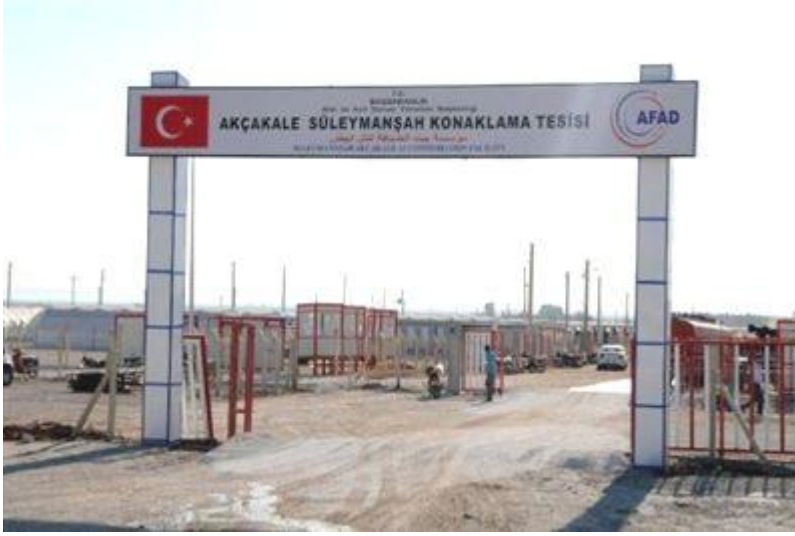
Süleymanşah Konteynerkent Mülteci kampı, Akçakale, Şanlıurfa

Türkiye’ye gelen yaklaşık 500 bin Suriyeli mülteci bulunduğu tahmin edilmektedir. 22 8 ayı ildeki 17 mülteci kampında 200 binden fazla 23 mülteci kalırken, yaklaşık 300 bin kişi de kamplar dışında yaşamaktadır. Kamp dışında kalanlar kendi imkânlarıyla ev kiralamakta veya akrabalarının yanında kalmaktadırlar. Serbest ikamet edenler, Türkiye’nin farklı illerinde hatırı sayılır mülteci grupları oluşturmuştur.