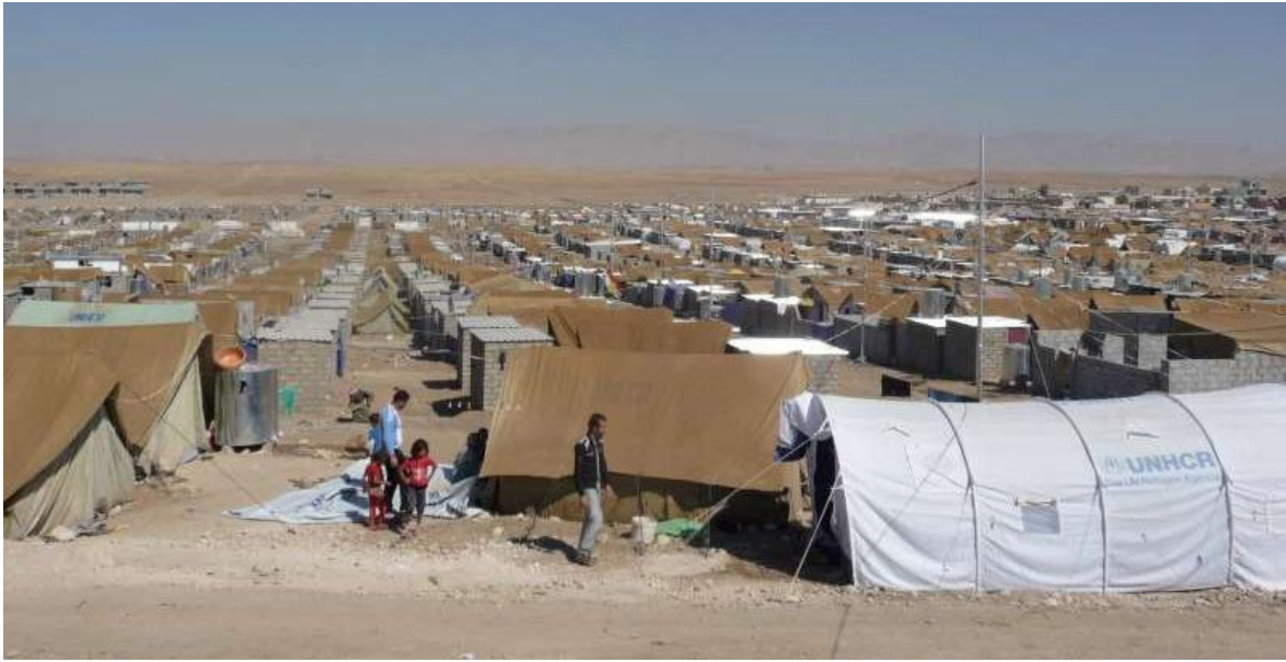
Domiz Mülteci kampı, Dohuk, Kürdistan, Irak

Irak Merkezî Hükümeti, “acil vakalar” ve “aile birleşimi” dışında girişleri kabul etmemektedir. Mart 2013’ten bu yana ülkeye girişleri fiilen sona erdirmiştir. 17