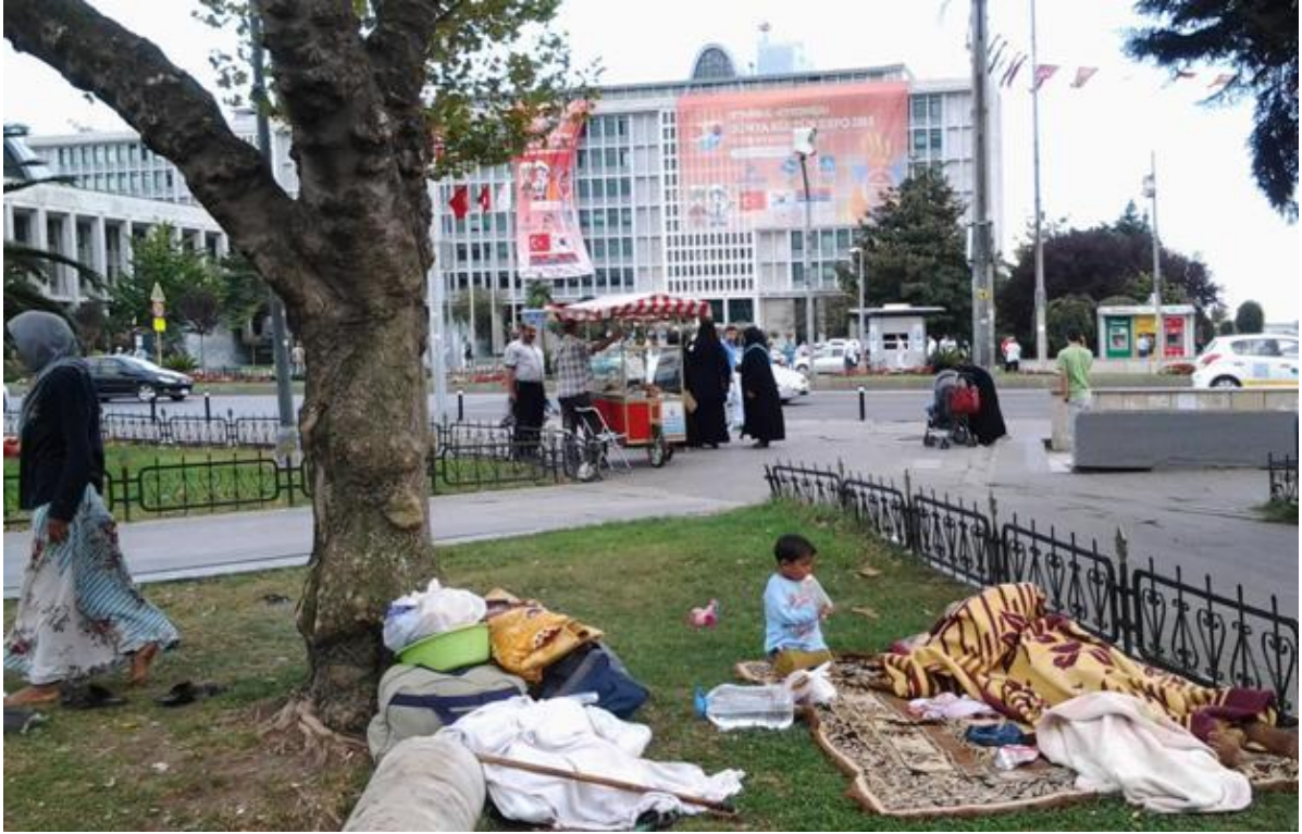
Şehzadebaşı parkında yatan mülteciler

Küçükpazar dışındaki semtlerde yaşayan mültecilerin daha iyi şartlarda barınma ihtiyacını karşıladıkları yapılan görüşmelerde dile getirilmiştir. Altınşehir'deki Suriyeli bir ailenin ihtiyaç duyduğu ev malzemesini Başakşehir Belediyesinin temin ettiği ve hayırsever vstandaşların da yardımcı oldukları belirtilmiştir.