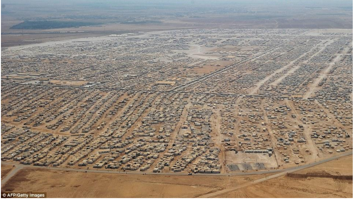
Ürdün 'de Zaatarı Mülteci kampı

Yaklaşık 2 milyon Suriyeli mültecinin üçte ikisi 2013 yılı başından itibaren Suriye'yi terk etmiştir ki bu, günlük ortalama altı binin üzerinde insanın ülkesini terk ettiğini göstermektedir. Bu sayıların önemli çoğunluğunu kadınlar ve çocuklar oluşturmaktadır. 11