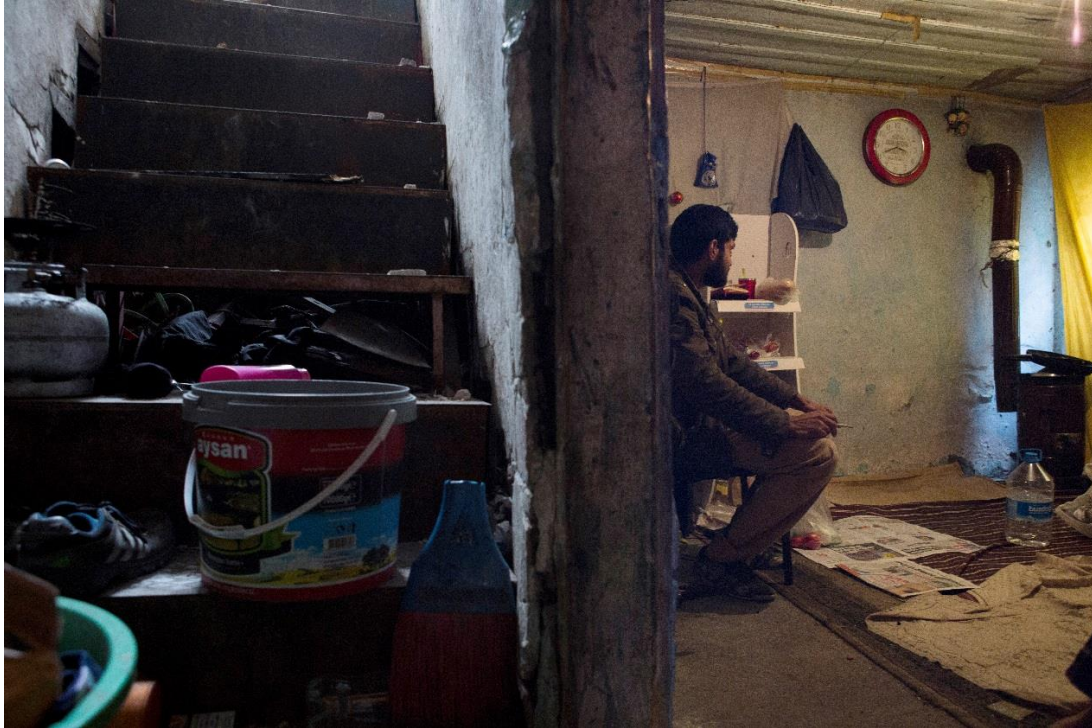
İstanbul'da yaşayan Afgan bir sığınmacı. Afganlar için ne Türkiye'de entegre olmak ne de başka bir ülkeye yerleştirilmek gerçekçi bir seçenek.

Bu bölümde AB-Türkiye Anlaşması çerçevesinde sığınmacı ve mültecilerin Türkiye'ye geri gönderilebilmeleri için karşılanması gereken ikinci şart, yani geri gönderilenlerin "kalıcı çözüm" olarak anılan mekanizmalara erişimi tartışılıyor. BMMYK, kalıcı çözüm şartının, eğer güvenli ise menşe ülkeye geri dönüş, entegrasyon ve üçüncü ülkeye yeniden yerleştirme olmak üzere üç farklı şekilde olabileceğini tespit ediyor. Türkiye'de yaşayan mültecilere yönelik geniş ölçekli bir yeniden yerleştirme programının en azından bugüne kadar tesis edilmediği ve hem Suriyeliler hem de diğer mülteci grupları için güvenli geri dönüşün çok düşük bir olasılık olduğu bir çerçevede, uzun süreli bir statüye ve buna bağlı haklara sahip olmak özel bir önem kazanıyor. Türkiye'nin mültecilere kalıcı çözüm sunma imkânı ise, Avrupalı olmayanlara tam bir mülteci statüsü vermeyi reddetmesi nedeniyle ciddi düzeyde bir sorun teşkil ediyor.