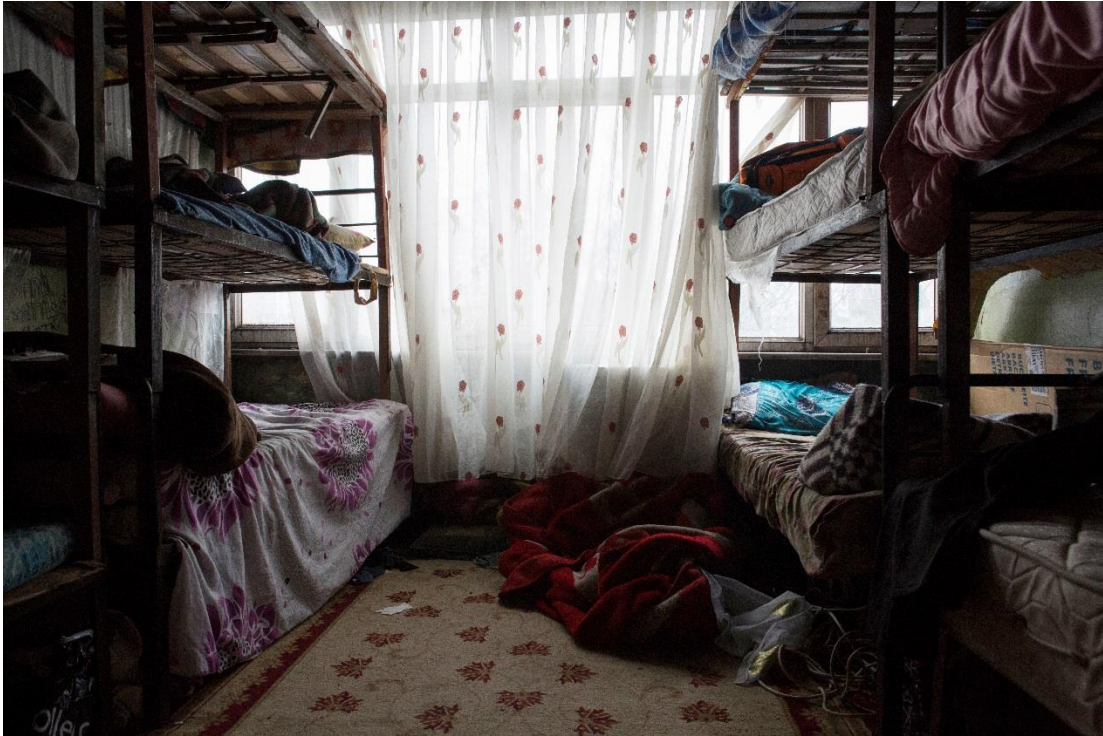
Altında çöpten topladıkları geri dönüştürülebilir atıkların tartıldığı ve tasnif edildiği bir atölye olan bu odada Afganistan'dan gelen yaklaşık 12 sığınmacı yaşıyor.

Bu bölümde Türkiye'nin etkili korumanın üçüncü şartını karşılayıp karşılamadığı, yani sığınmacı ve mülteciler için yeterli yaşam standartlarına erişebilmelerini sağlayacak geçim kaynakları imkânı sunup sunmadığı tartışılıyor. Devlet yetkilileri tarafından insanların temel ihtiyaçlarının, özellikle de barınma ihtiyacının karşılanmaması, insanların kendi kendine yetebilirliği sağlamada karşılaştıkları engellerle birlikte değerlendirildiğinde Türkiye'nin sığınmacı ve mülteciler için onurlu bir yaşam sağlayacak ortamı oluşturmayı başaramadığı ortaya çıkıyor.