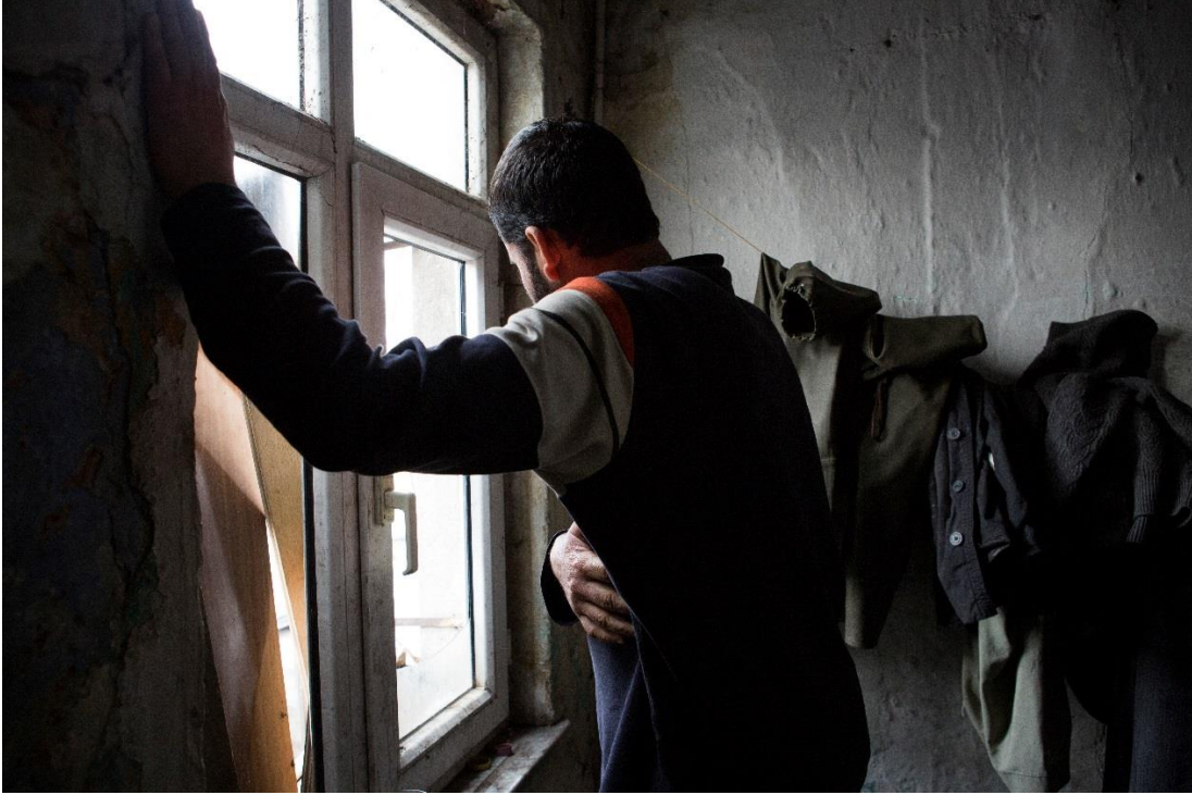
İstanbul'daki evinin penceresinden dışarıyı izleyen Afgan bir sığınmacı.

Bir mültecinin Türkiye'den üçüncü bir ülkeye yeniden yerleştirme için ne kadar bekleyeceği, bir dizi unsura bağlı olarak değişiyor. Bekleme sürelerinde yerel sığınma prosedürünün tamamlanması için geçen zamana ek olarak, uluslararası toplumun taahhüt ettiği yeniden yerleştirme kotaları da belirleyici bir rol oynuyor. AB'ye üye olan ve dünyanın diğer bölgelerinde bulunan müreffeh devletler, 1951 Cenevre Sözleşmesi 'nde düzenlenen uluslararası işbirliği kavramı doğrultusunda, Türkiye'de yaşayan üç milyon sığınmacı ve mültecinin bir bölümünün sorumluluğunu paylaşmalı ve bu toplulukların zamanlı bir biçimde yeniden yerleştirme ve diğer "kabul yolları"na (mültecilerin ülkeye yasal yollardan giriş ve yasal olarak ikametini sağlayan seçenekler) erişimlerini sağlamalıdır. Ancak dünyadaki ülkelerin büyük bir kısmı, yalnızca Türkiye nezdinde değil, aynı zamanda yüksek sayıda mülteciyi ağırlayan diğer devletler nezdindeki yeniden yerleştirme sorumluluklarından kaçmaya devam ediyorlar. 74 Hâlihazırda dünyada sadece 30 ülke yeniden yerleştirme programları çerçevesinde başka ülkelere mülteci kabul ediyor. 75