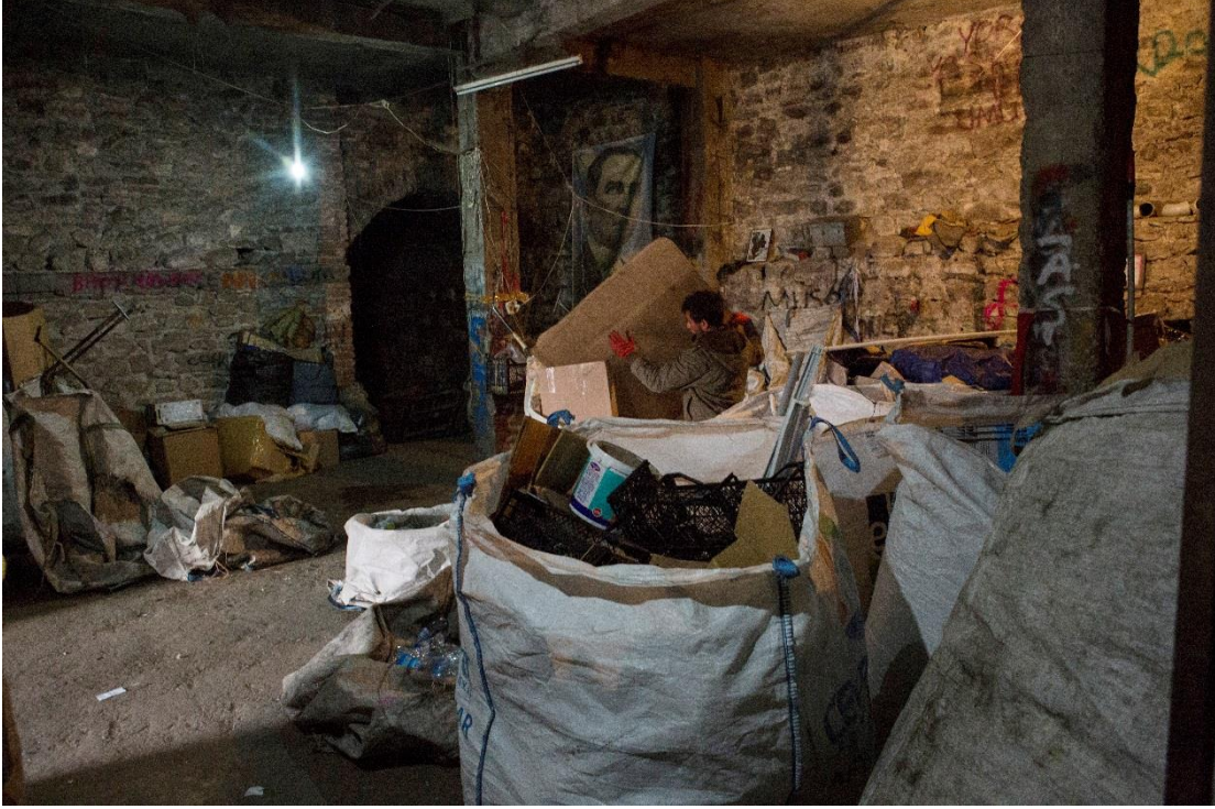
İstanbul’daki birçok Afgan sığınmacı, çöplerden topladıkları geri dönüştürülebilir atıkları satarak geçimlerini sağlıyorlar. Bu atıklar daha sonra resimde görülen yer gibi depolarda tartılıp tasnif ediliyor.

Türkiye yetkilileri bu konudaki verileri yayımlamasa da, sığınmacı ve mültecilerin kayıtlı ekonomide istihdam edilebilmelerine dair mevcut yasal ve pratik zorlukların, ülkenin üç milyonluk sığınmacı ve mülteci nüfusunun kendilerine ve ailelerine bakabilmek için kayıt dışı işlerde çalışma durumunda kalması muhtemel görünüyor. 2016 yılı başında, Türkiye’de işsizlik neredeyse %11 128 oranındaydı ve bu oranın kendisi de çok sayıda mültecinin kayıtlı ekonomiye dâhil edilmesinin pek mümkün olmayacağına işaret ediyor.