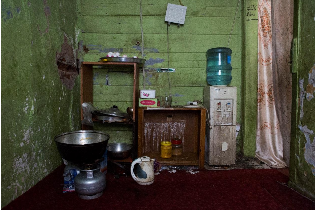
İstanbul'da yaşayan 15 Afgan ve Pakistanlı sığınmacının mutfağı

odun sobasıydı. Araştırmacıların ziyaret ettiği yerlerden bir diğeri ise içinde 12 ranza olan, hijyenik olmayan ve havasız tek göz bir odaydı. Uluslararası Af Örgütü araştırmacıları bu odada yaşayan üç Afgan erkek ile mülakatlar gerçekleştirdi. Söz konusu odanın altında ayrıca toplanan geri dönüştürülebilir atıkların tartıldığı ve tasnif edildiği bir atölye bulunuyordu. Uluslararası Af Örgütü araştırmacıları İstanbul'da ayrıca Baghlan eyaletinden gelen 52 yaşındaki Afgan müteahhittin birkaç yetişkin erkekle paylaştığı konutu da gördüler. Bu kişilerin yaşadıkları yer bodrum katta bulunan küçük, hijyenik olmayan bir tekstil atölyesiydi. Baghlanlı müteahhit, araştırmacılara kirasını ödeyemediğinde cami, park, metro istasyonları gibi kamusal mekanlarda yatmak zorunda kaldığını anlattı. 95 Araştırmacılar ayrıca tek göz, kısmen bodrum katı bir odada yaşayan ve Musul'dan gelen Iraklı yaşlı bir çiftle de (erkek 74, kadın ise 65 yaşındaydı) görüştü: bu yaşlı çiftin tek göz odalarındaki eşyalar iki adet tek kişilik yatak, bir masa, bir de buzdolabından ibaretti. 96