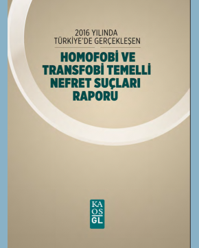
2016 Nefret Suçları Raporu