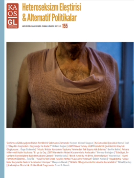
Sayı 155: Heteroseksizm Eleştirisi & Alternatif Politikalar