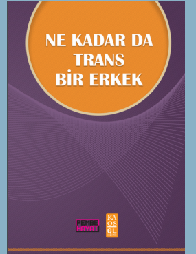
Ne Kadar da Trans Bir Erkek