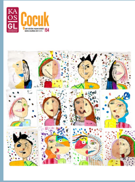
Sayı 154: Çocuk