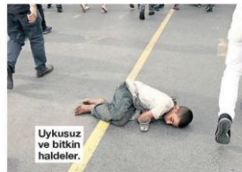
Uykusuz ve bitkin haldeler.