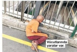
Vücutlarında yaralar var.