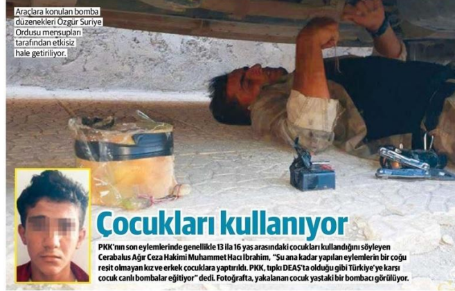
Araçlara konulan bomba düzenekleri Özgür Suriye Ordusu mensupları tarafından etkisiz hale getiriliyor.

Alınan önlemlerle Türkiye içinde eylem yapma imkânı kalmayan terör örgütü PKK, Suriye'ye yöneldi. 17 ayrı saldırıda 93 sivilin hayatını kaybetmesine neden olan terör örgütü, bu saldırılarda yaşları 13 ilâ 16 arasında değişen çocukları kullanıyor. Eylem hazırlığında yakalanan çocuklar, bomba konulması karşılığı 300 dolar ödendiğini itiraf etti