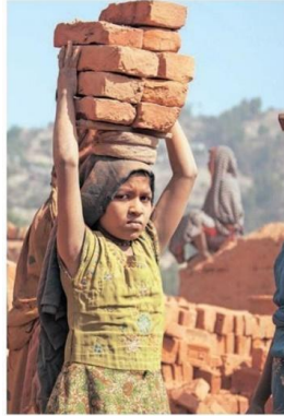
Tüm önlemlere rağmen dünyada çocuk işçiliğinin önüne geçilemiyor.

MERKEZİ Cenevre'de bulunan Uluslararası Çalışma Örgütü'nün (ILO) aktardığı verilerde, zorla çalıştırılanlar için fiziksel veya ruhsal olarak zarar gören, çocukluğu çalınan 18 yaş altındaki çocuklara değiniliyor. ILO'nun tahminlerine göre 2016 yılında dünyada 5-17 yaş arası yaklaşık 218 milyon çocuk çalışıyor. Bunun 152 milyonunda yasa dışı çocuk emeği söz konusu olduğunu belirten ILO, bu kategoriye girenlerin yansımın 12 yaş altında olduğunu söylüyor.