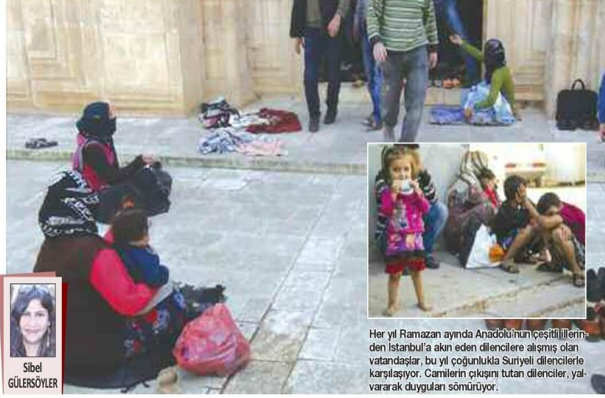
Her yıl Ramazan ayında Anadolu’nun çeşitli illerinden İstanbul’a akın eden dilencilere alışmış olan vatandaşlar, bu yıl çoğunlukla Suriyeli dilencilerle karşılaşılıyor. Camilerin çıkış bütan dilenciler, yalvararak duygularını sömürüyor.

Daha önce yapılan operasyonlarda yakalanan dilencilerin üzerinden çıkan para ise dudak uçuklatıyor. Bir günde binlerce lira kazanan dilencilerin bazıları ise İstanbul’daki 4 büyük dilenci çetesine bağlı olarak çalıştıkları iddia ediliyor. Yakalanan dilencilerin üzerlerinden çıkan paralara el konuluyor ve Kabahatler Kanunu’na göre para cezası kesiliyor. ● 9.sayfada