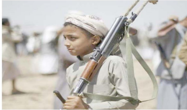
Ortadoğu, 14 Haziran 2018

EĞİTİM KURUMLARI CEZAEVİ YA DA KİŞLA Husilerin, 2 bin 372 okulu kısmen ya da tamamen yıktığını, bin 500'ü aşkın eğitim kurumunun da cezaevi ya da askeri kışla olarak kullanıldığını kaydeden Kemal, 4,5 milyondan fazla çocuğun ise okula gidemediğini ifade etti. Uzun süredir siyasi istikrarsızlığın hüküm sürdüğü Yemen'de, Husiler ile meşru yönetime bağlı güçler arasında çatışmalar yaşanıyor. Husiler, Eylül 2014'ten bu yana başkent Sana ve bazı bölgelerin denetimini elinde bulundururken Suudi Arabistan öncülüğündeki koalisyon güçleri ise Mart 2015'ten beri Husilere karşı Yemen hükümetine destek veriyor. (A.A.)