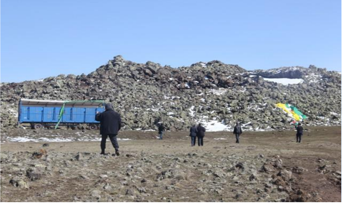
Bahse konu olan etkinlik(Şenlik) için kurulan platform ve etkinlik alanı. (Çatışma,Platformun arkasında bulunan kayalık bölgede yaşandı)