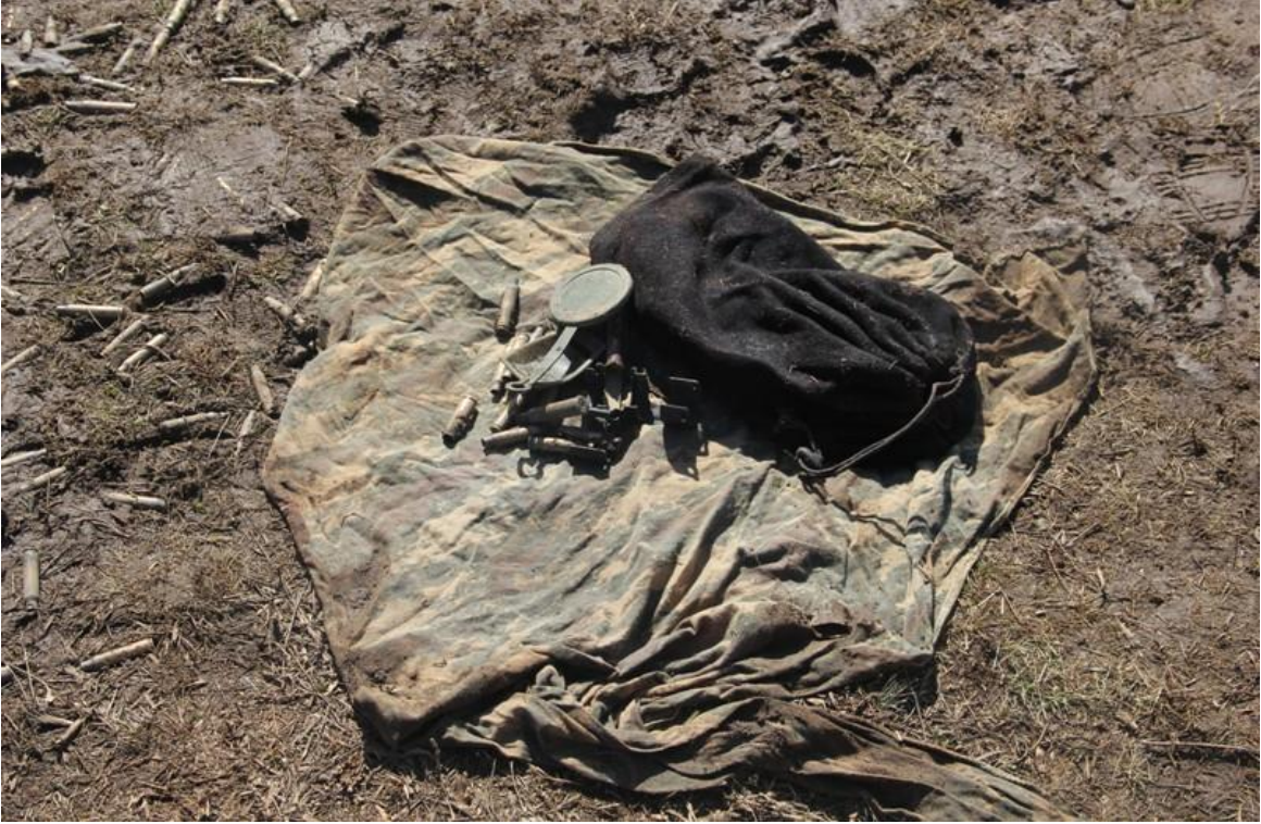
Askerlere ait bazı kıyafet ve eşyalar(Çatışma Bölgesi)