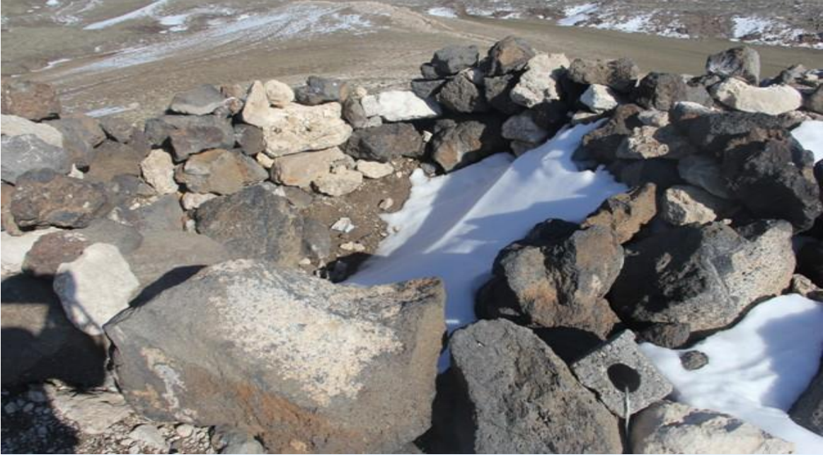
Askerlerin siper olarak kullandığı kayalıklar