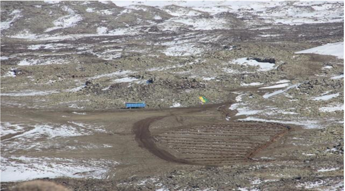
Etkinlik(Şenlik) alanı, fidanların dikileceği kazılı alan, platform ve çatışma alanından genel görünüm.