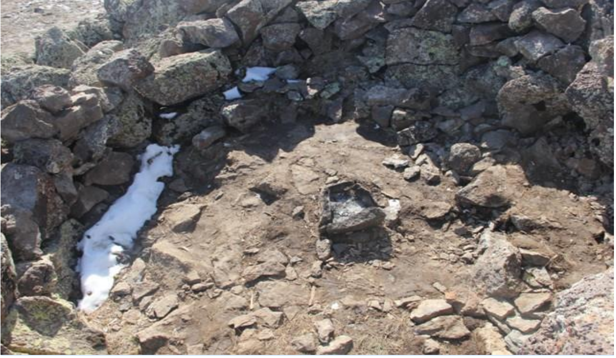
PKK Mensuplarının, kayalıklar arasına kurdukları çadırın bulunduğu nokta.