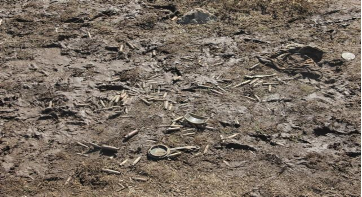
Boş kovanlar ve askerlere ait bazı eşyalar