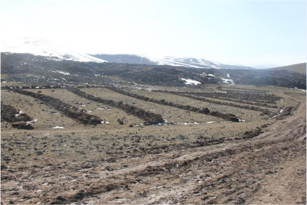
Fidan dikilmesi düşünölen kazılı alan