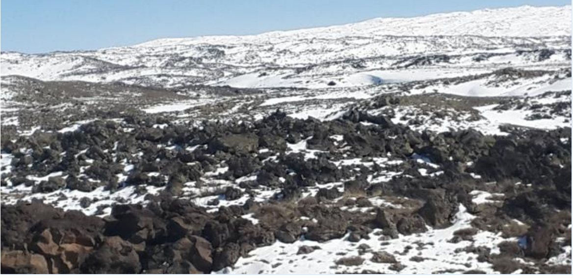
Çatışmanın Yaşandığı Kayalık Bölge