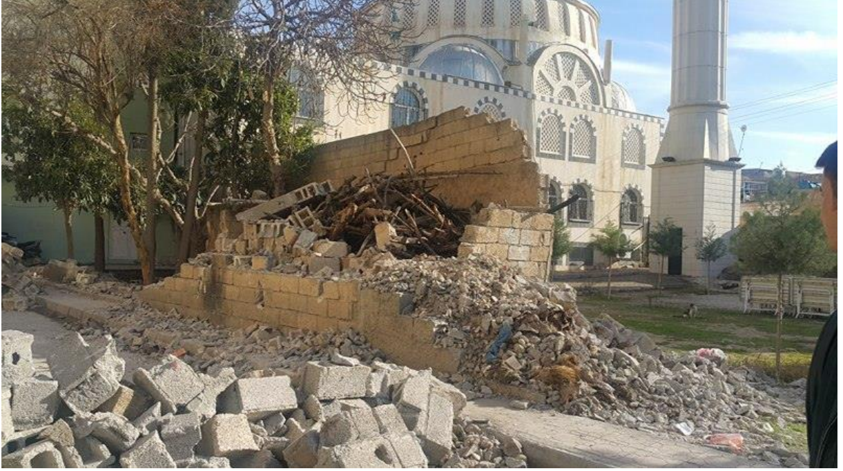
*Mele Musa Camii