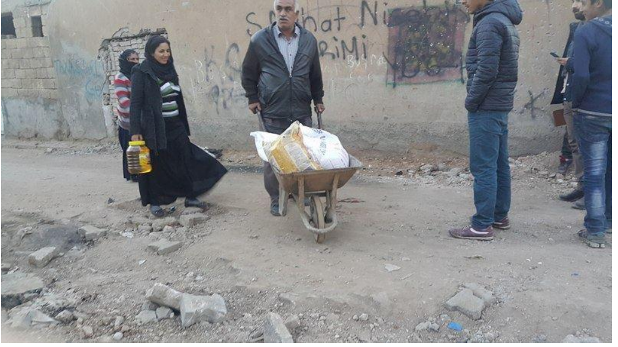
ÇATIŞMA İZLEME VE ÇÖZÜM GURUBU